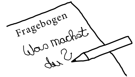
c Sich ein Bild vom Arbeiten machen